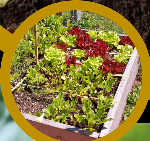
Aplicación en cultivos

Taller inter-trimestral 23-0 Duración 8 horas